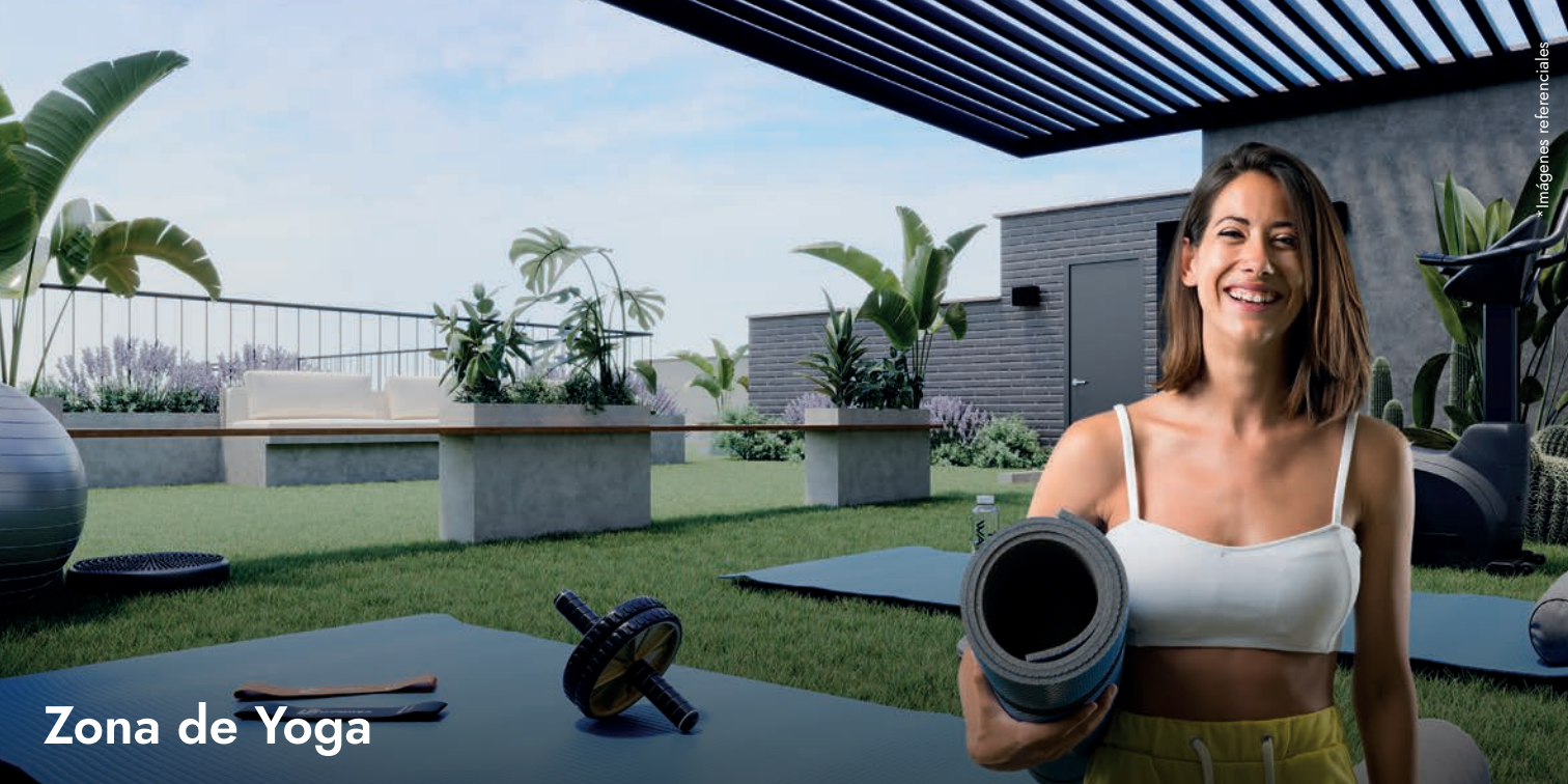
Zona de Yoga